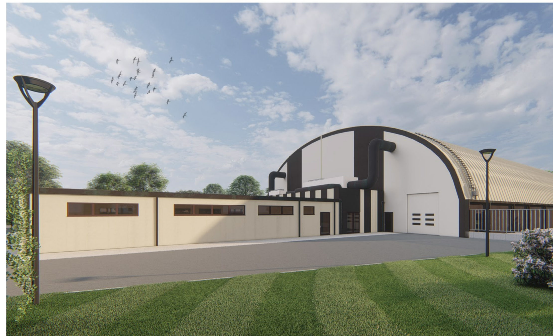
Punto di vista 04 - Angolo Nord/Ovest