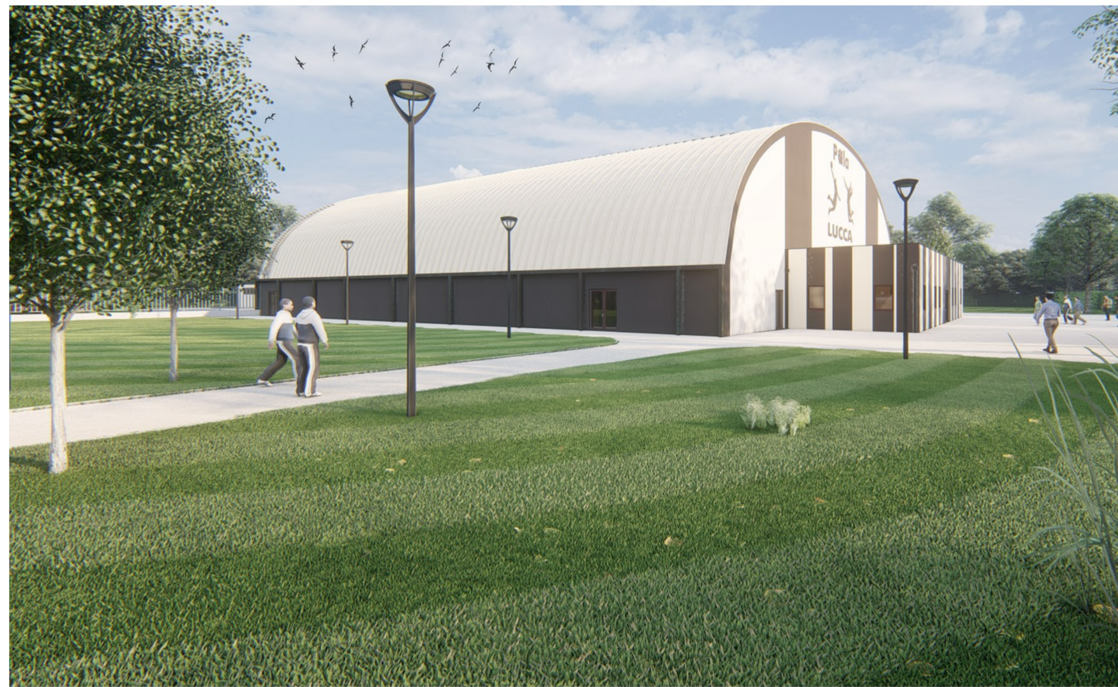
Punto di vista 02 - Angolo Sud/Ovest