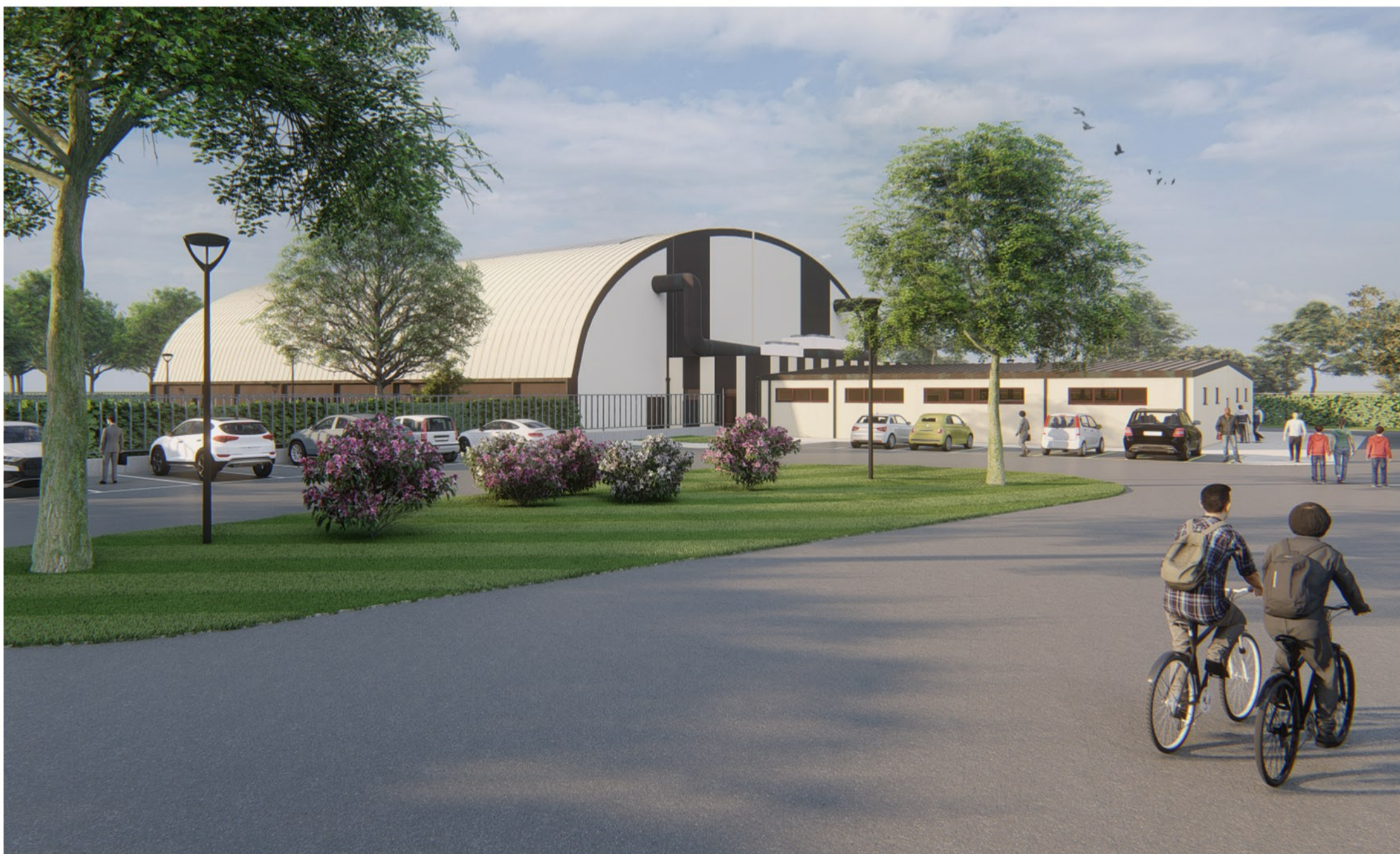
Punto di vista 03 - Angolo Nord/Est