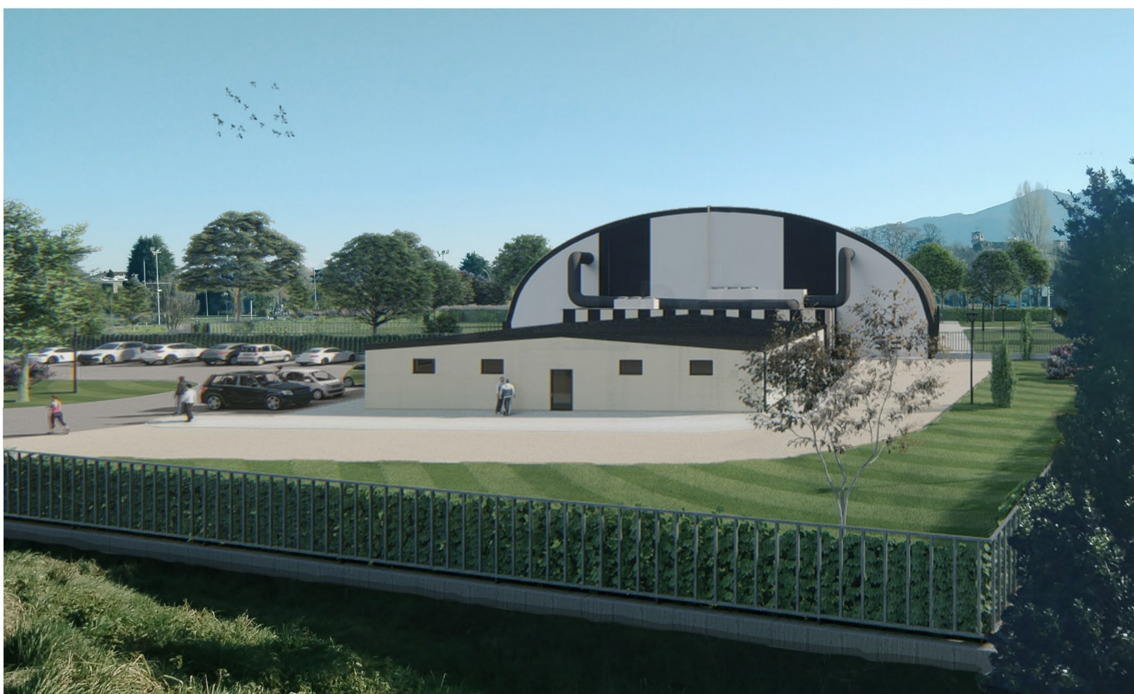
Fotoinserimento 01 - Vista dall'argine del fiume Serchio