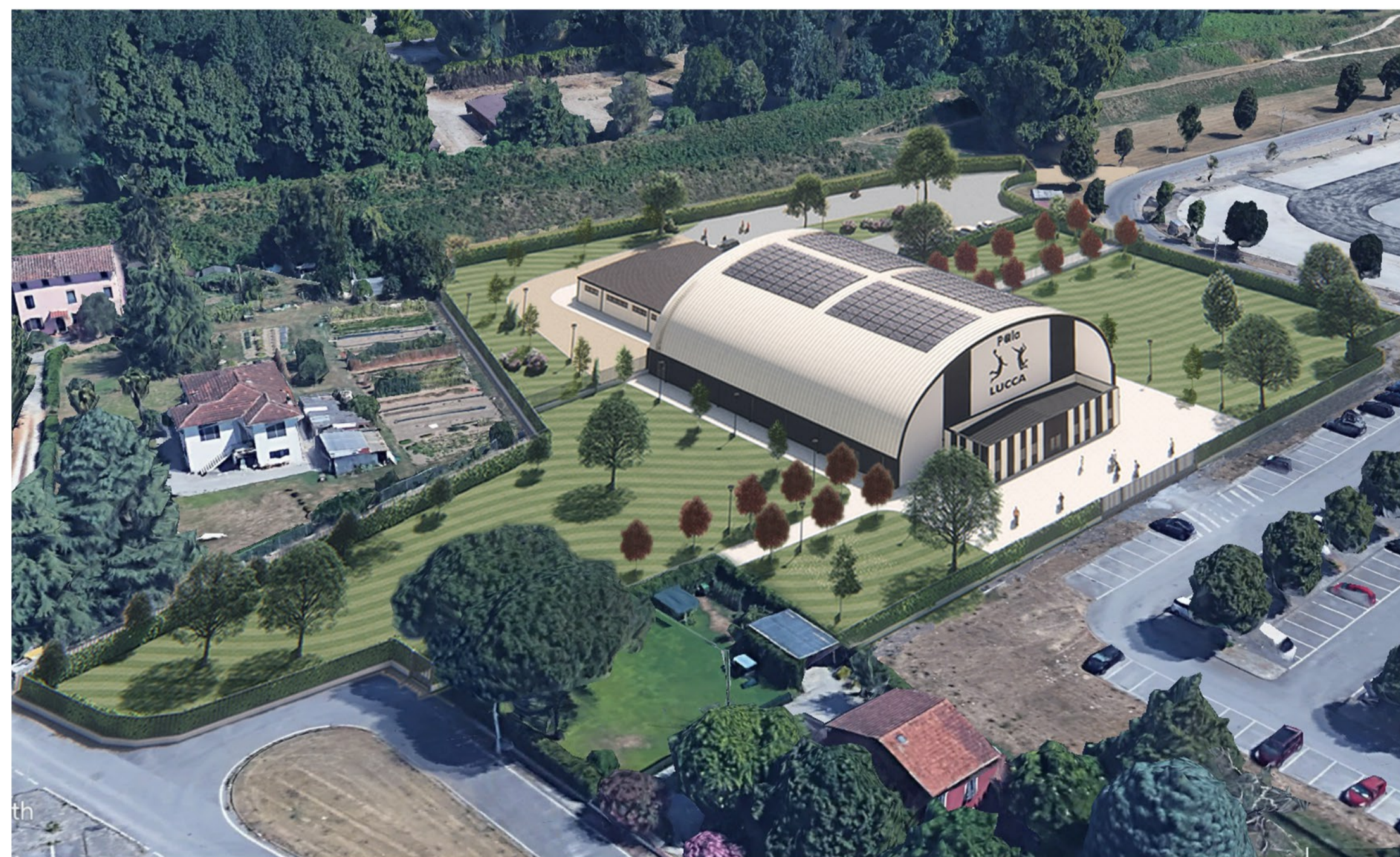
Fotoinserimento 02 - Vista aerea dal "Palatagliate"