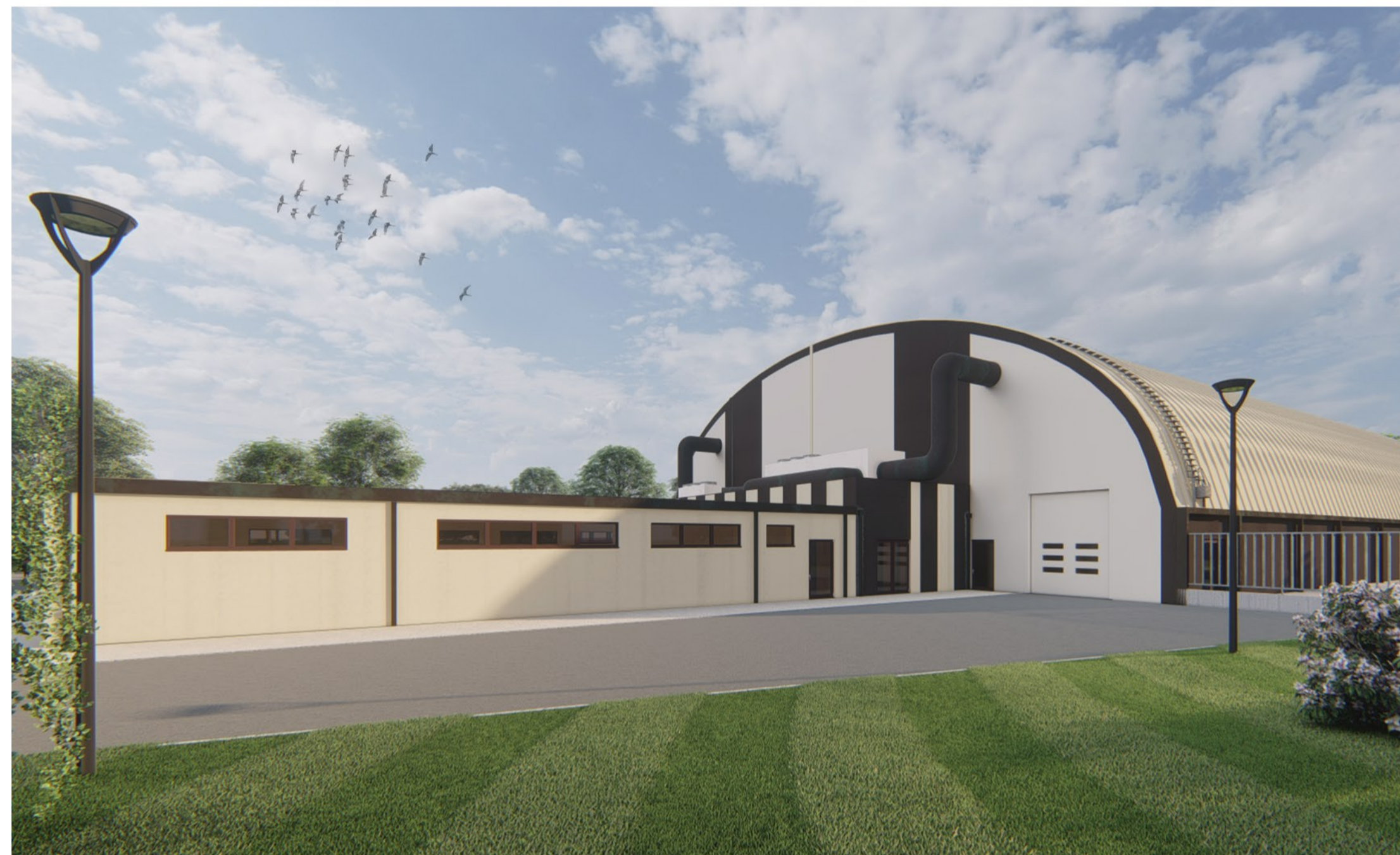
Punto di vista 04 - Angolo Nord/Ovest