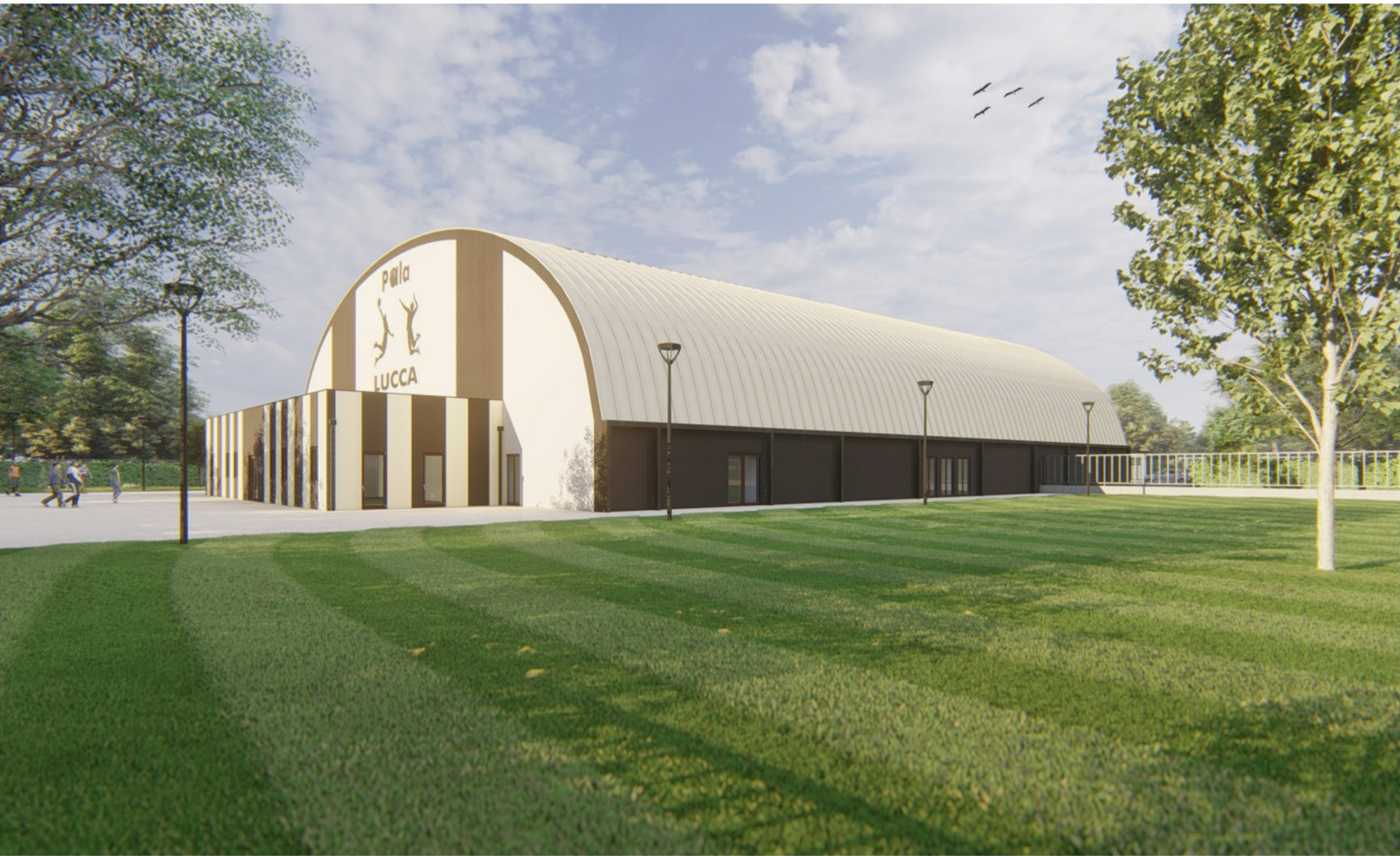
Punto di vista 01 - Angolo Sud/Est