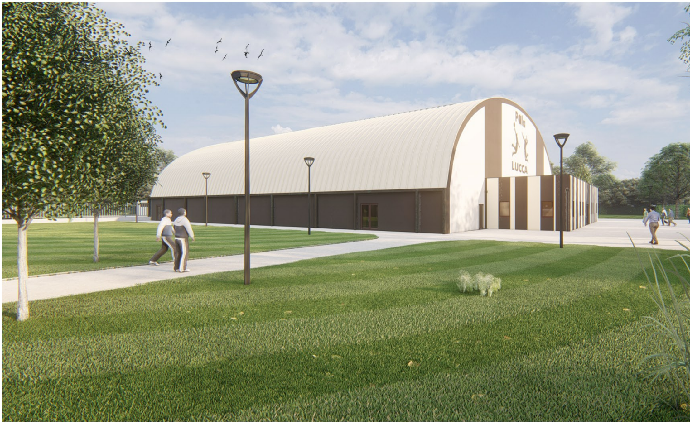
Punto di vista 02 - Angolo Sud/Ovest