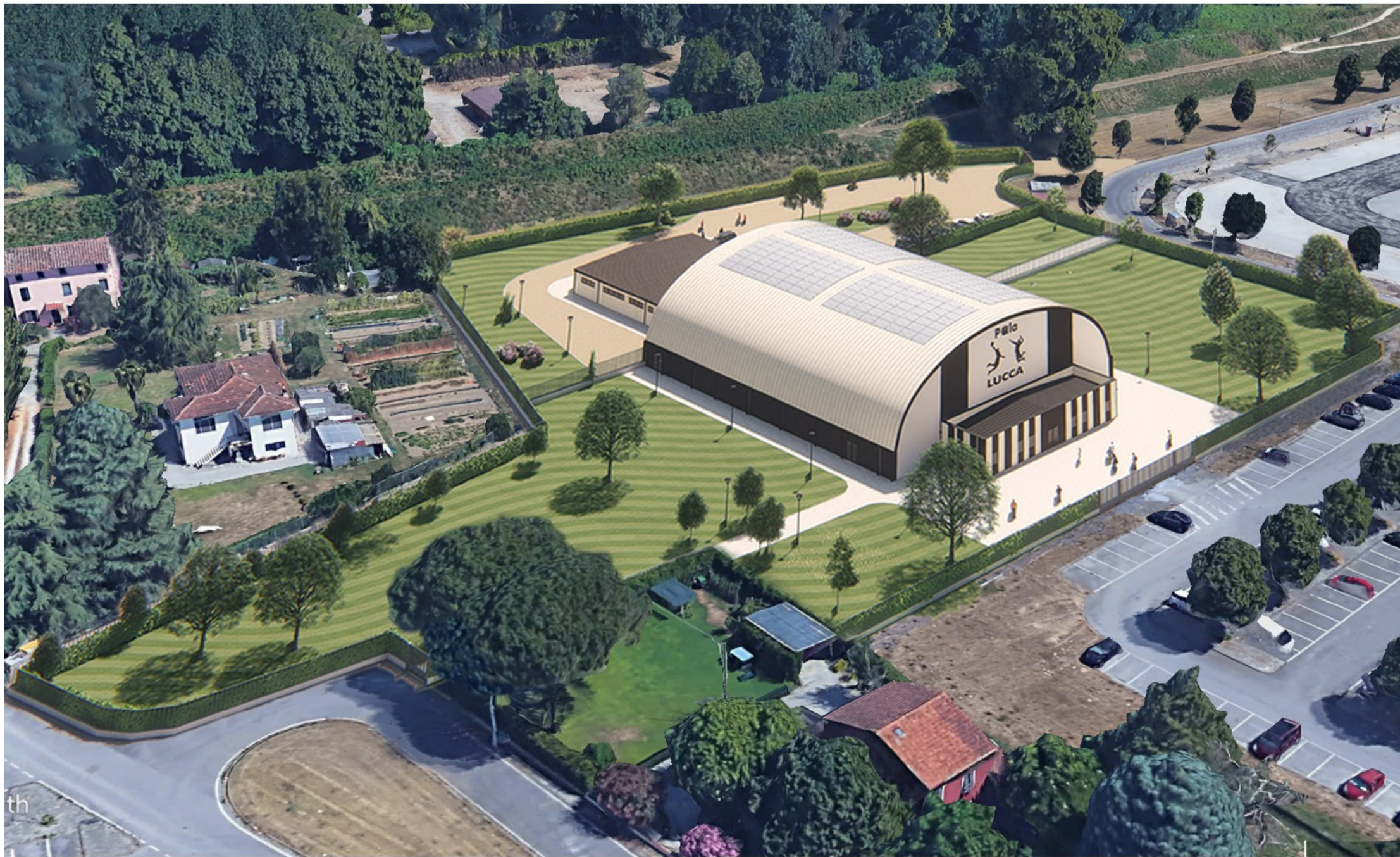
Fotoinserimento 02 - Vista aerea dal "Palatagliate"