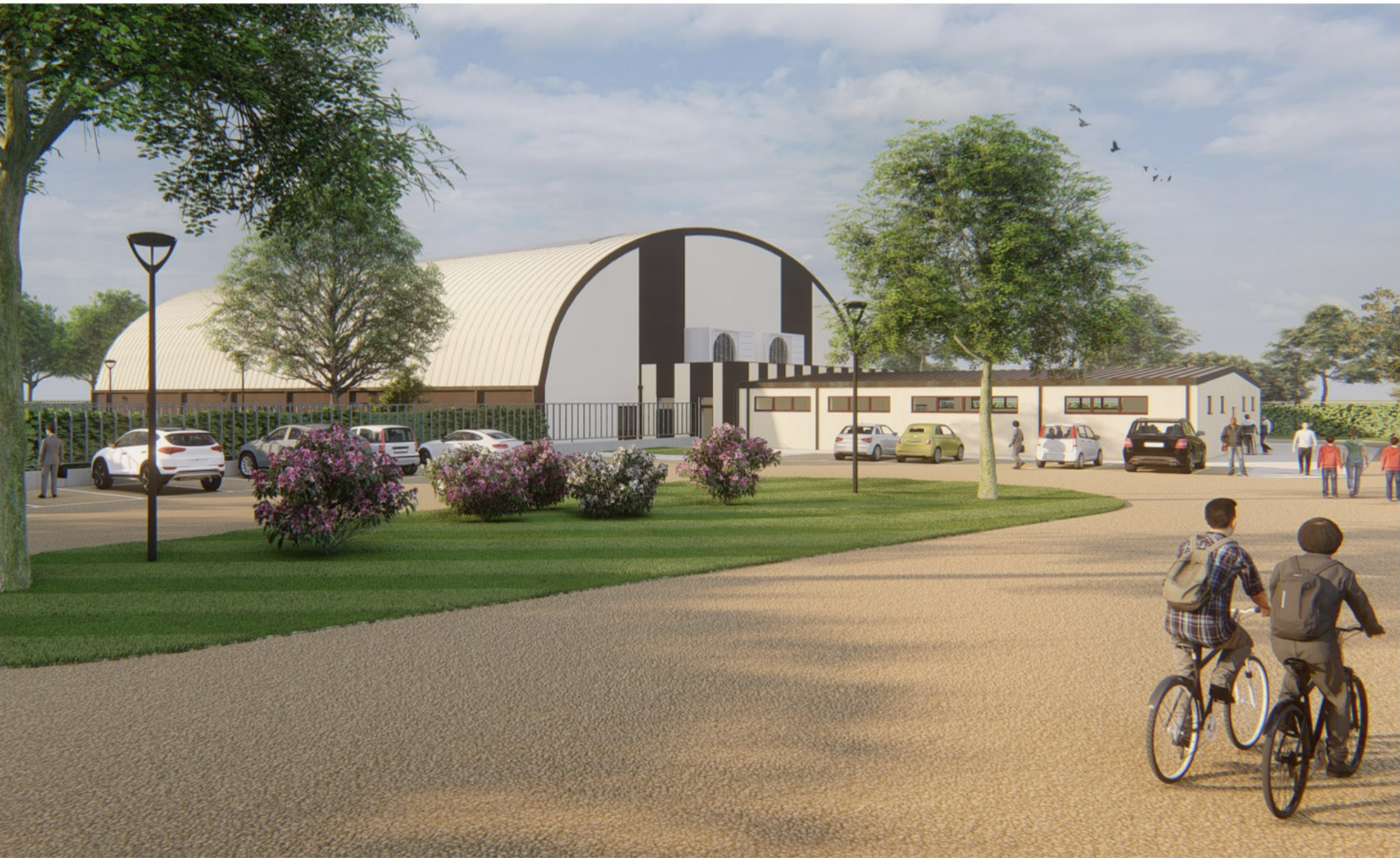
Punto di vista 03 - Angolo Nord/Est