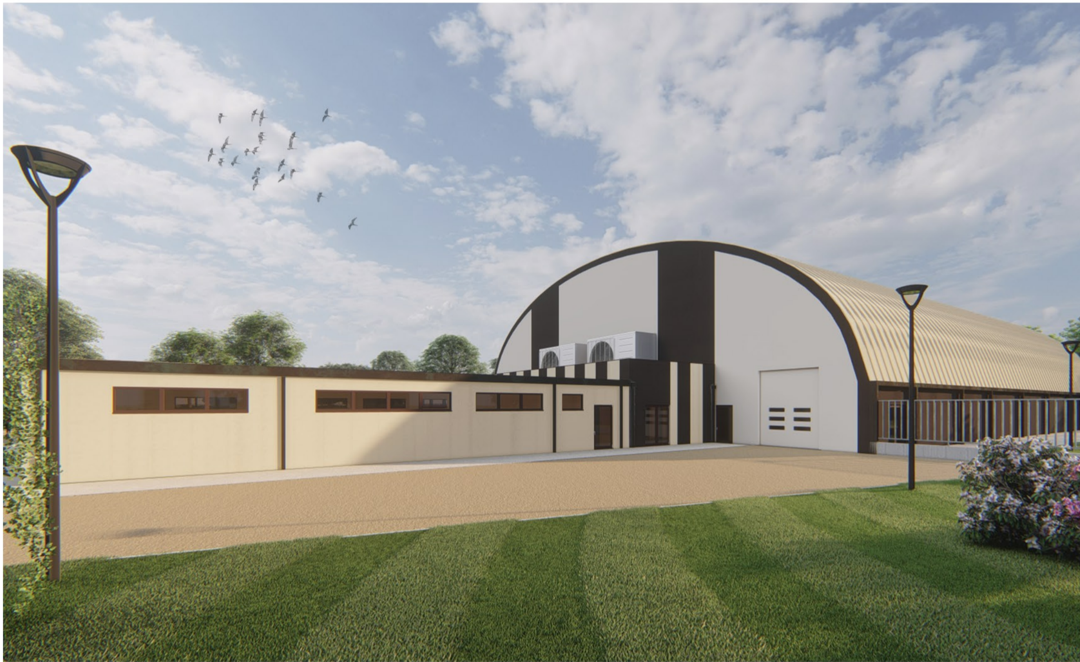
Punto di vista 04 - Angolo Nord/Ovest