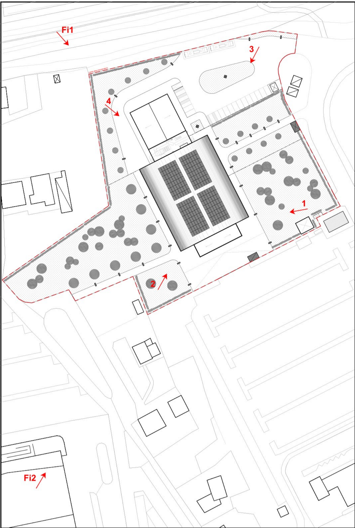
Punti di vista