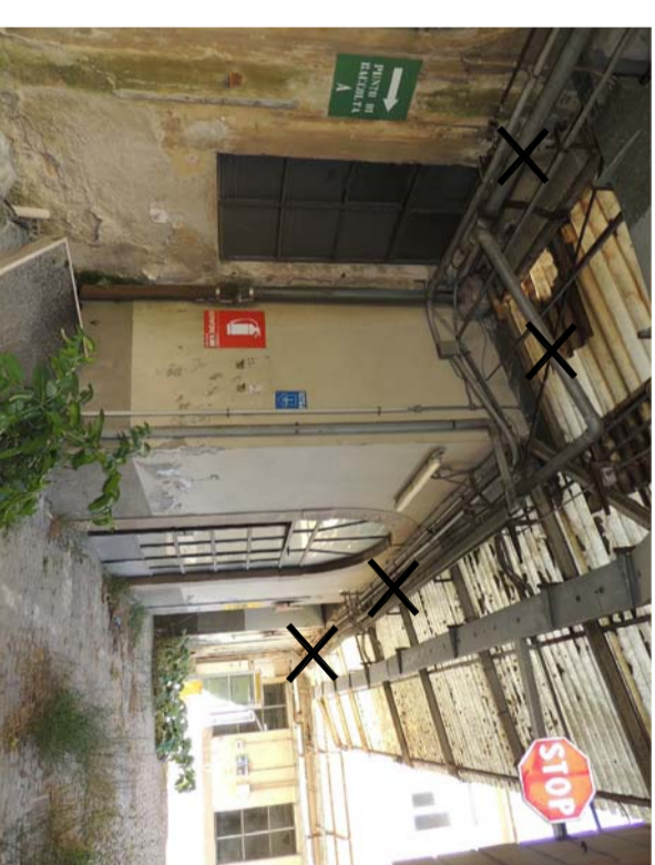
1 RIMOZIONE TIPO 20 Particolare