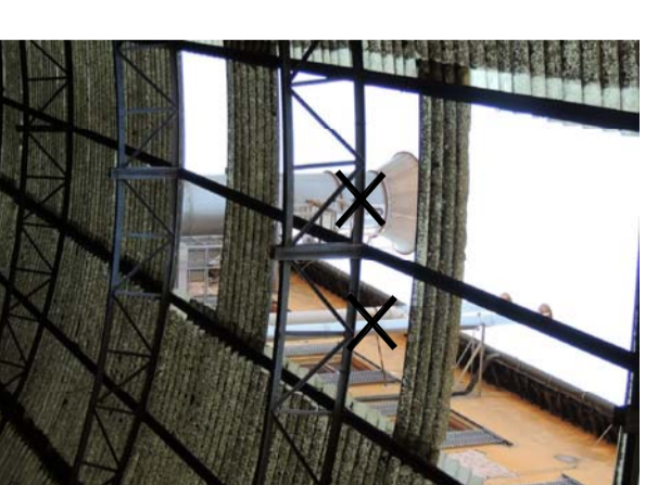
5 RIMOZIONE TIPO 30 Particolare