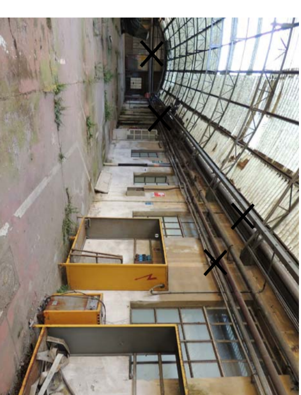
4 RIMOZIONI TIPO 20-27 Particolare