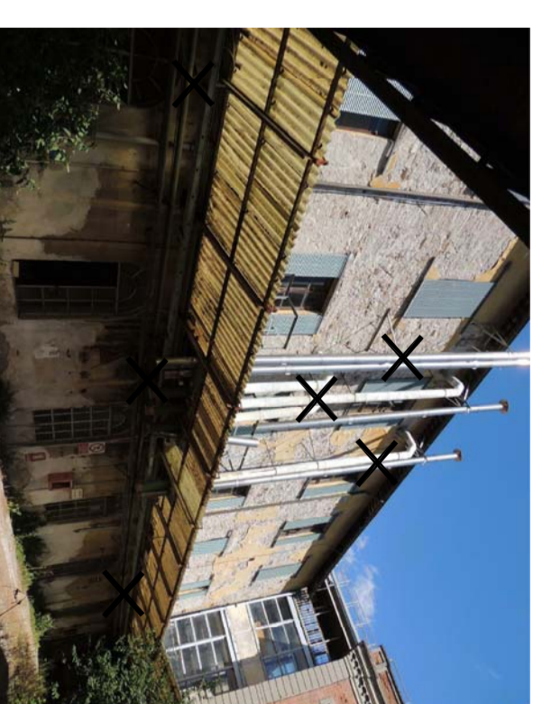
2 RIMOZIONI TIPO 20-27 Particolare