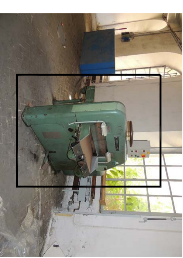
3 LAVORAZIONE TIPO 28 Particolare macchinario da spostare