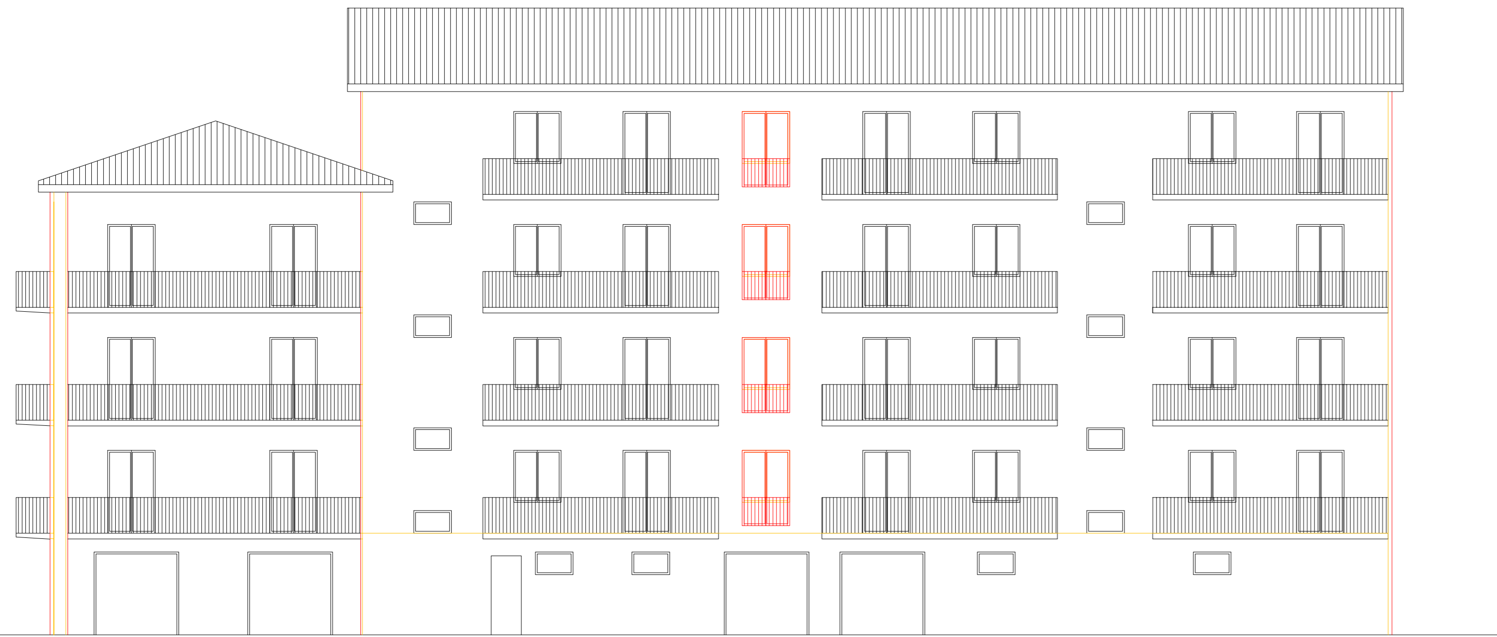
PROSPETTO NORD STATO SOVRAPPOSTO