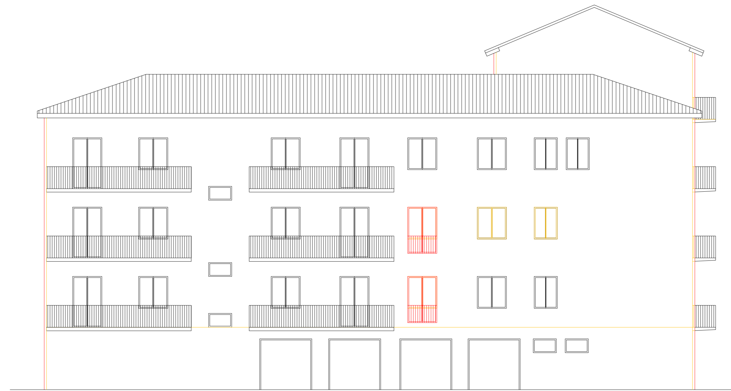
PROSPETTO EST STATO SOVRAPPOSTO