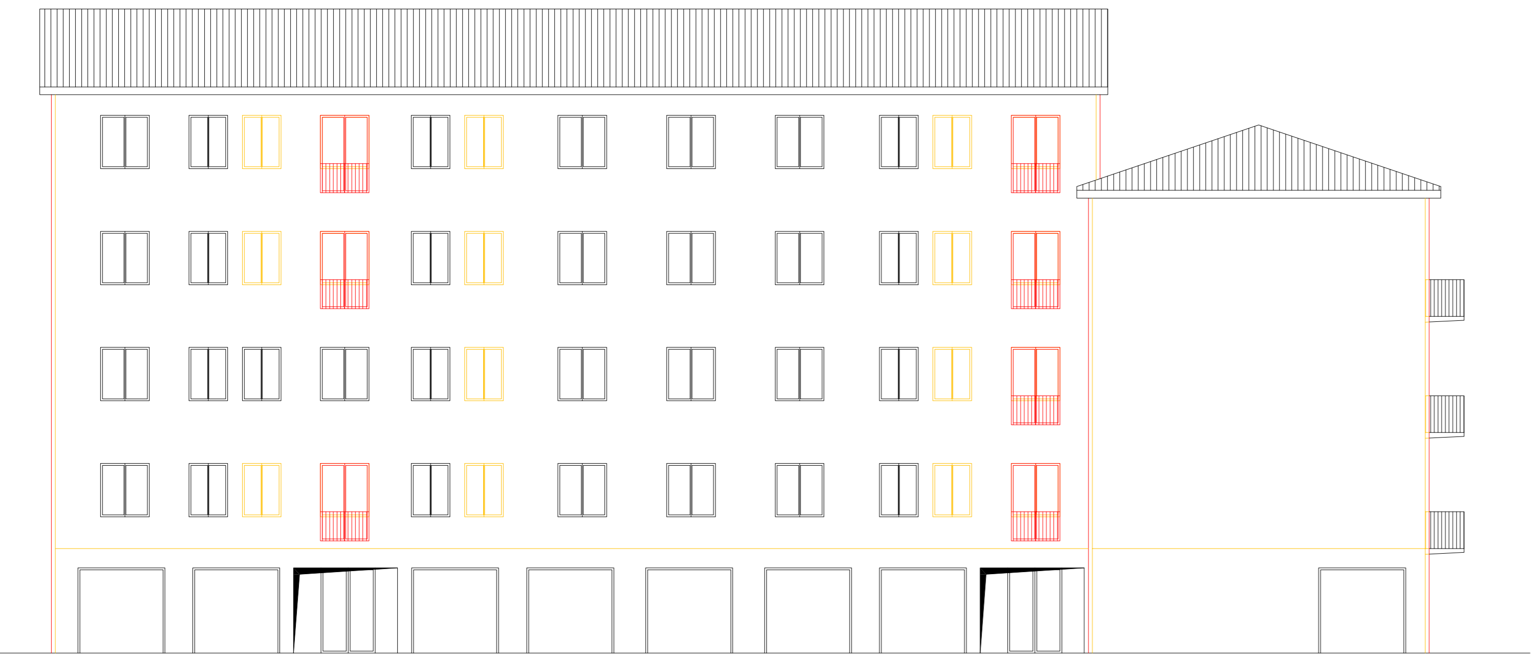
PROSPETTO SUD STATO SOVRAPPOSTO