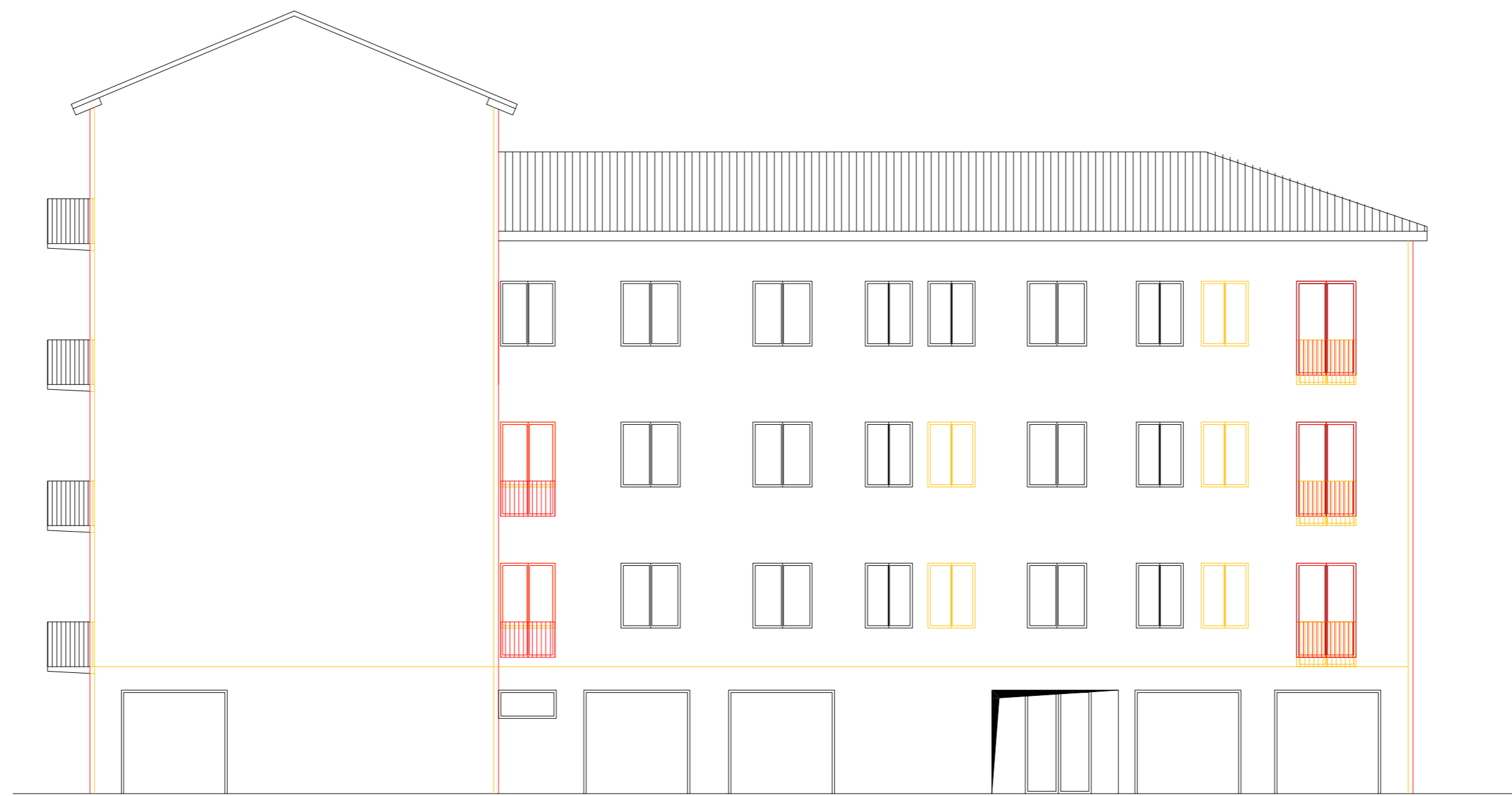
PROSPETTO OVEST STATO SOVRAPPOSTO