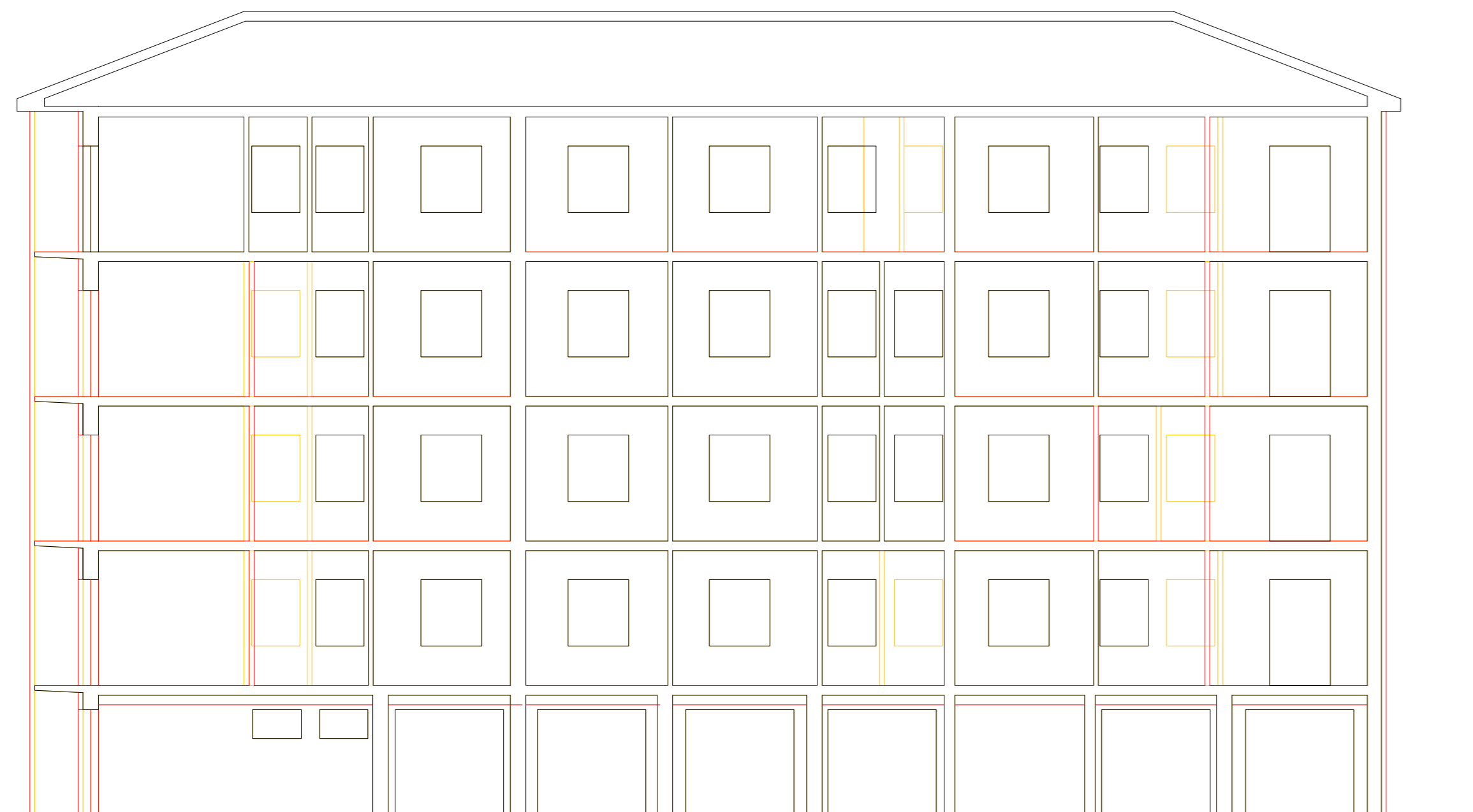
SEZIONE A - A STATO SOVRAPPOSTO