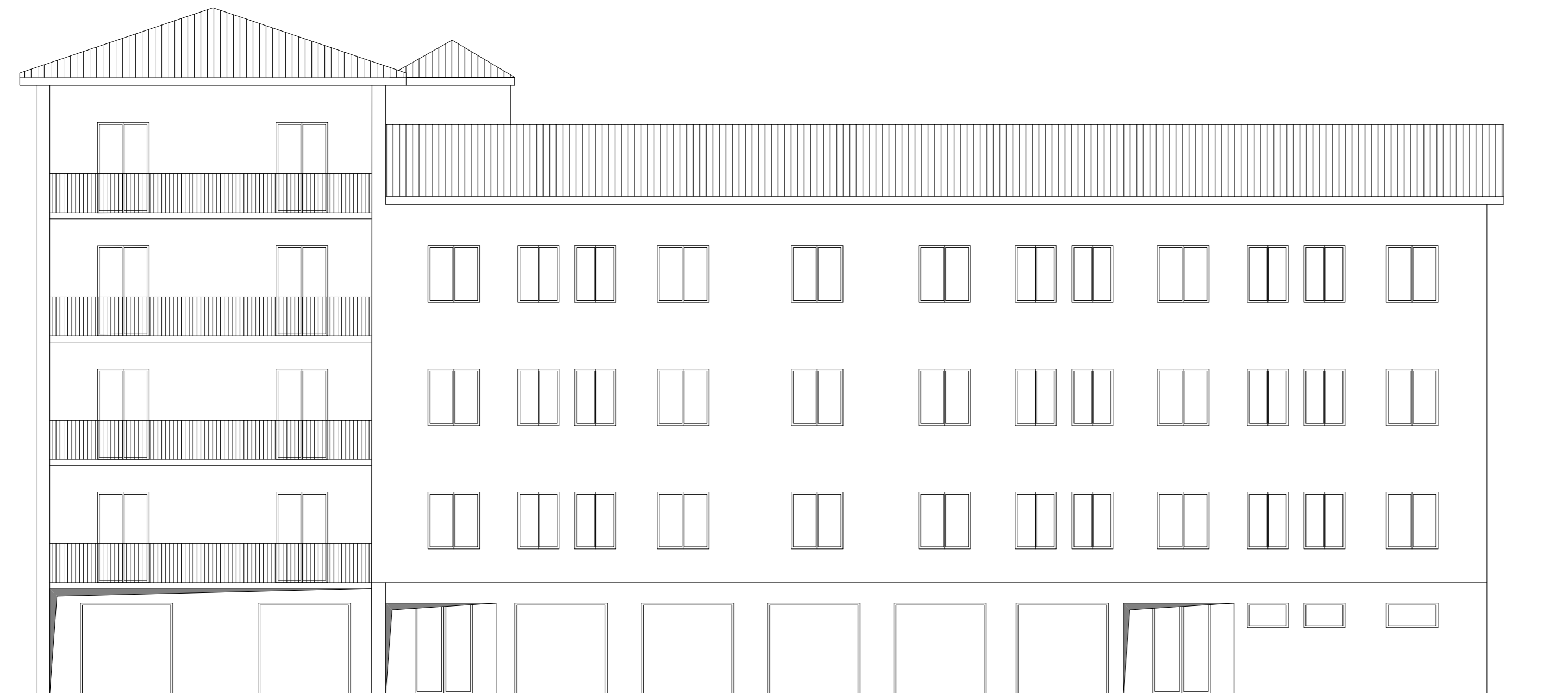
PROSPETTO SUD STATO ATTUALE