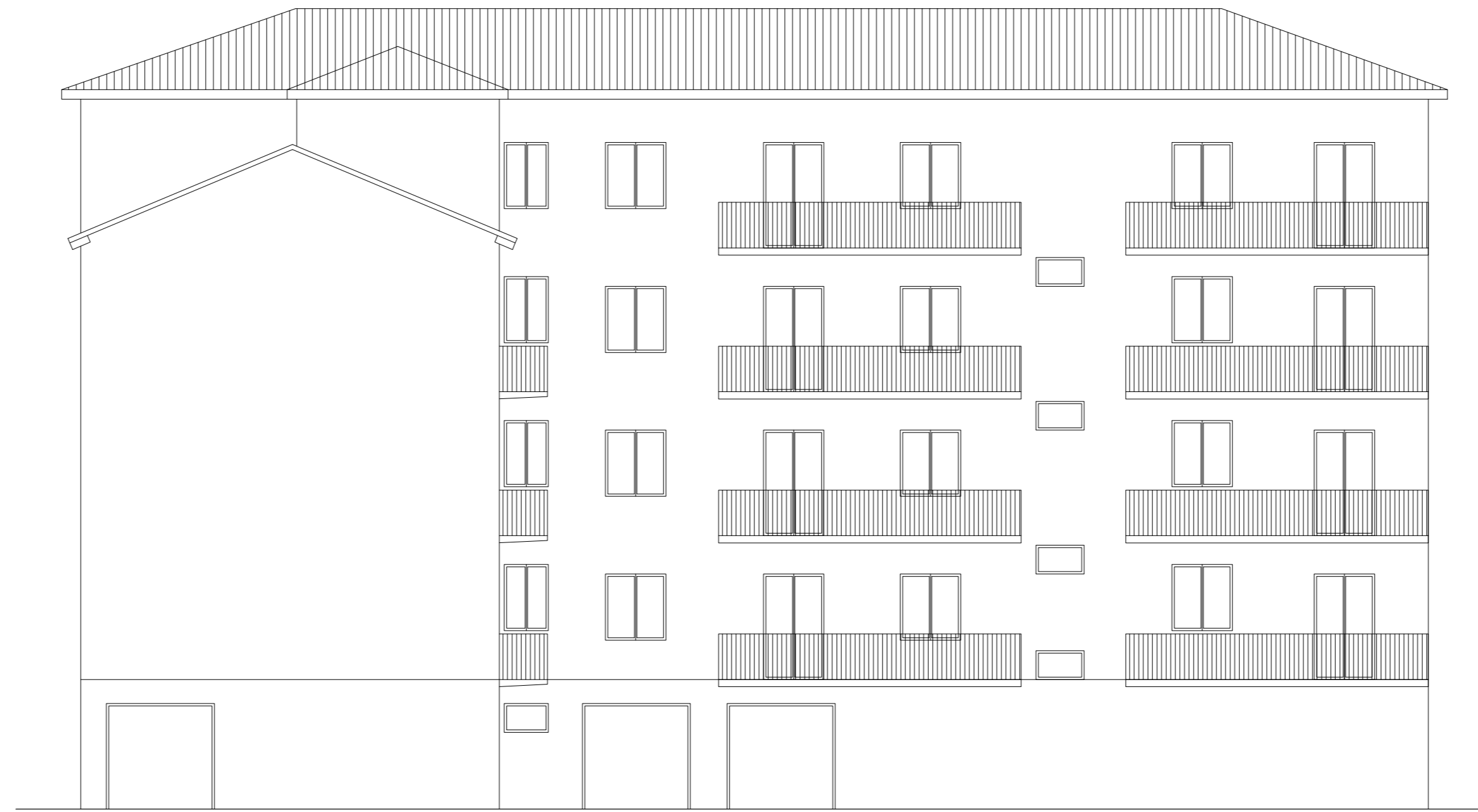
PROSPETTO EST STATO ATTUALE