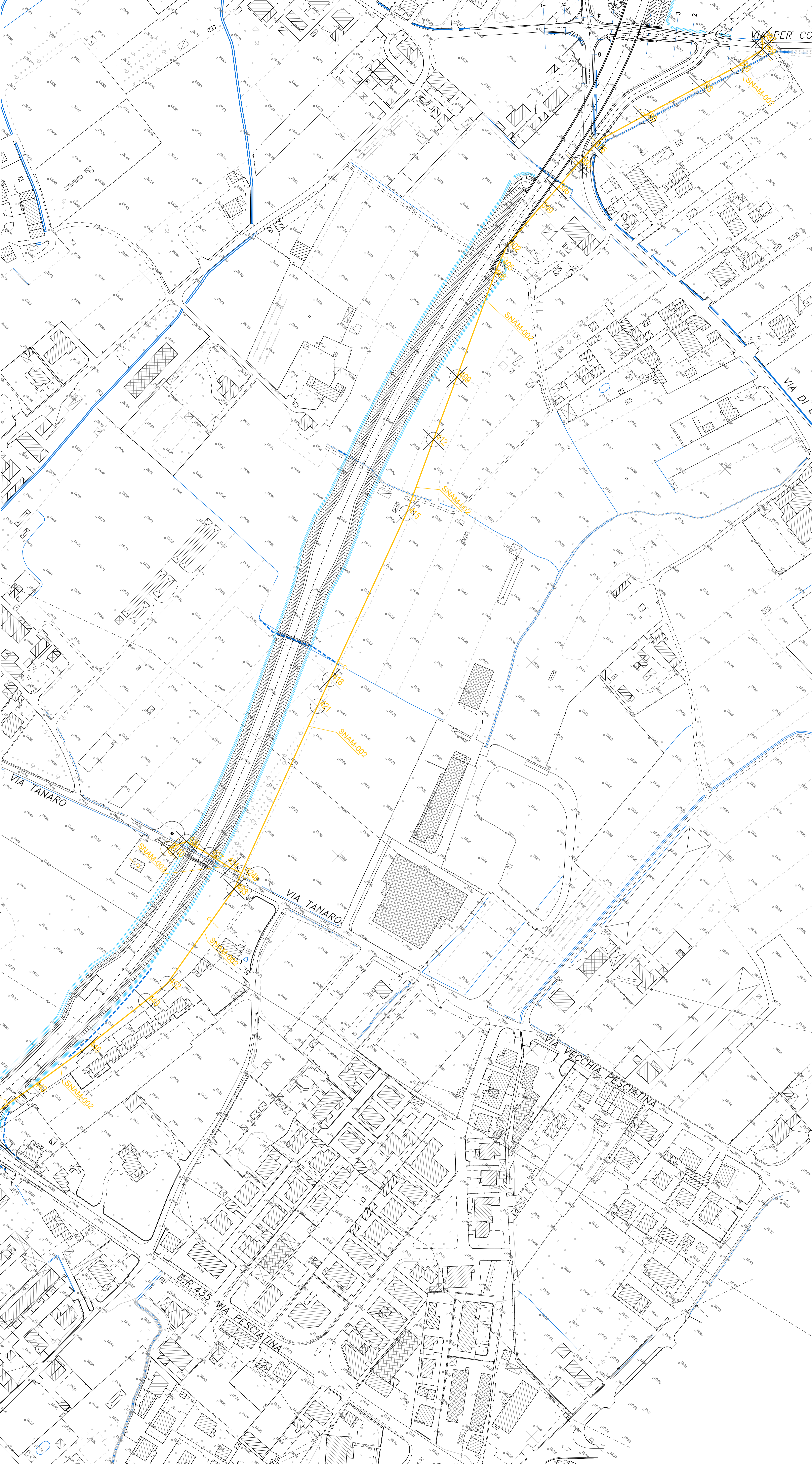
PROFILLO LONGITUDINALE CONDOTTA SNAM-002