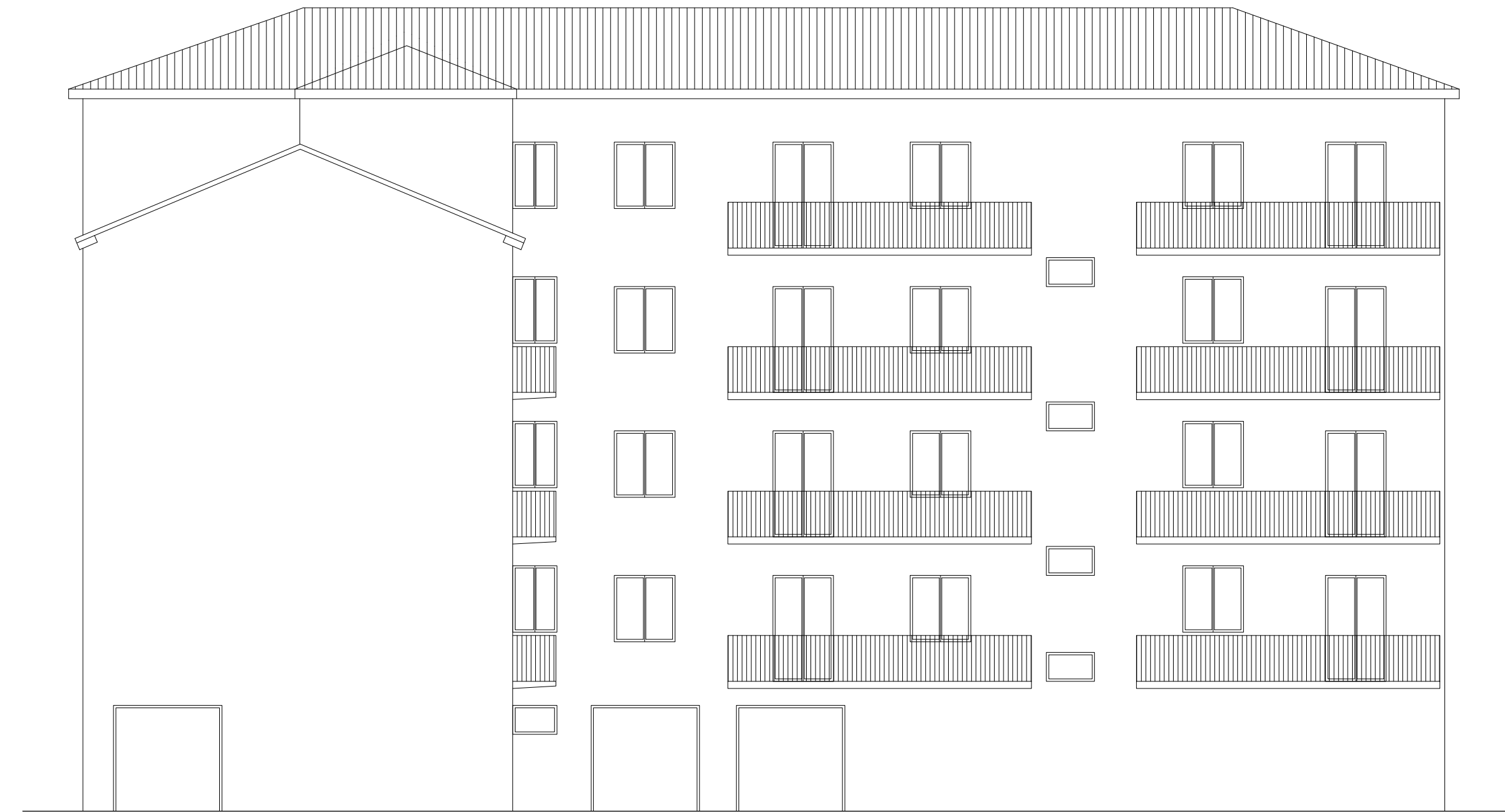
PROSPETTO EST STATO di PROGETTO