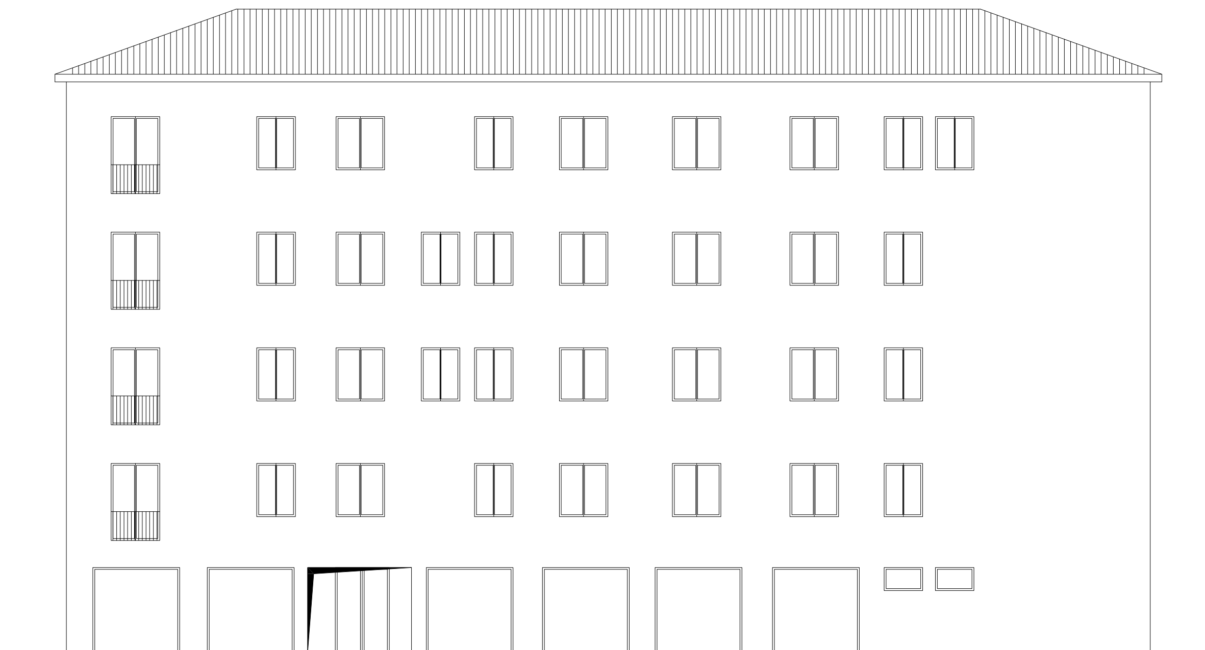
PROSPETTO OVEST STATO di PROGETTO