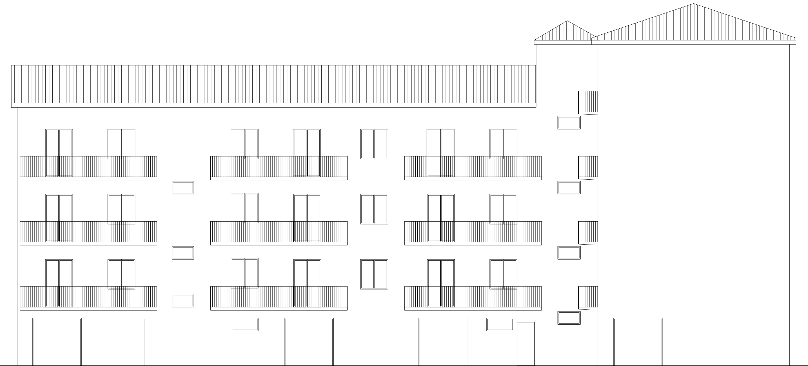
PROSPETTO NORD STATO di PROGETTO