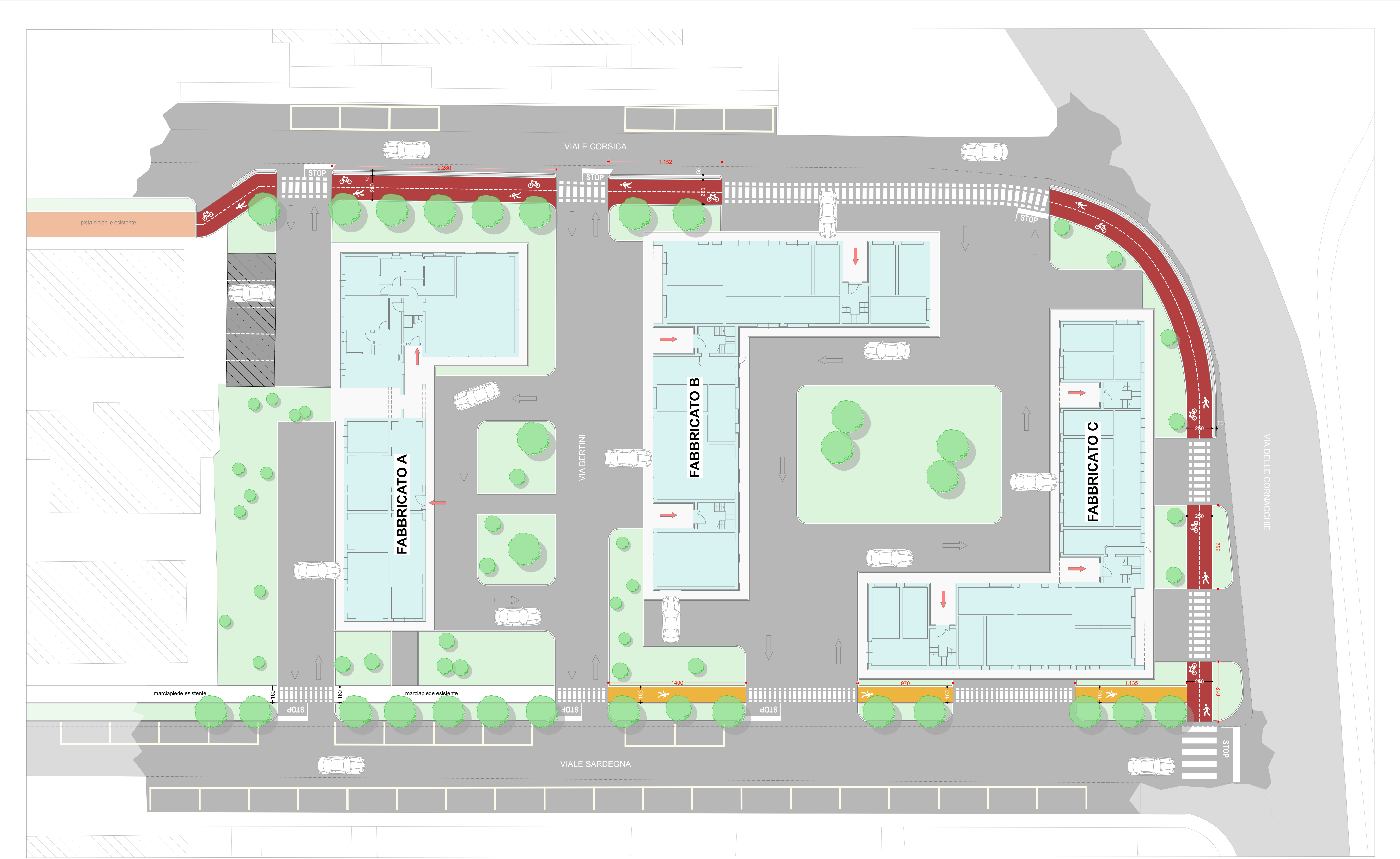
PLANIMETRIA GENERALE 1:200