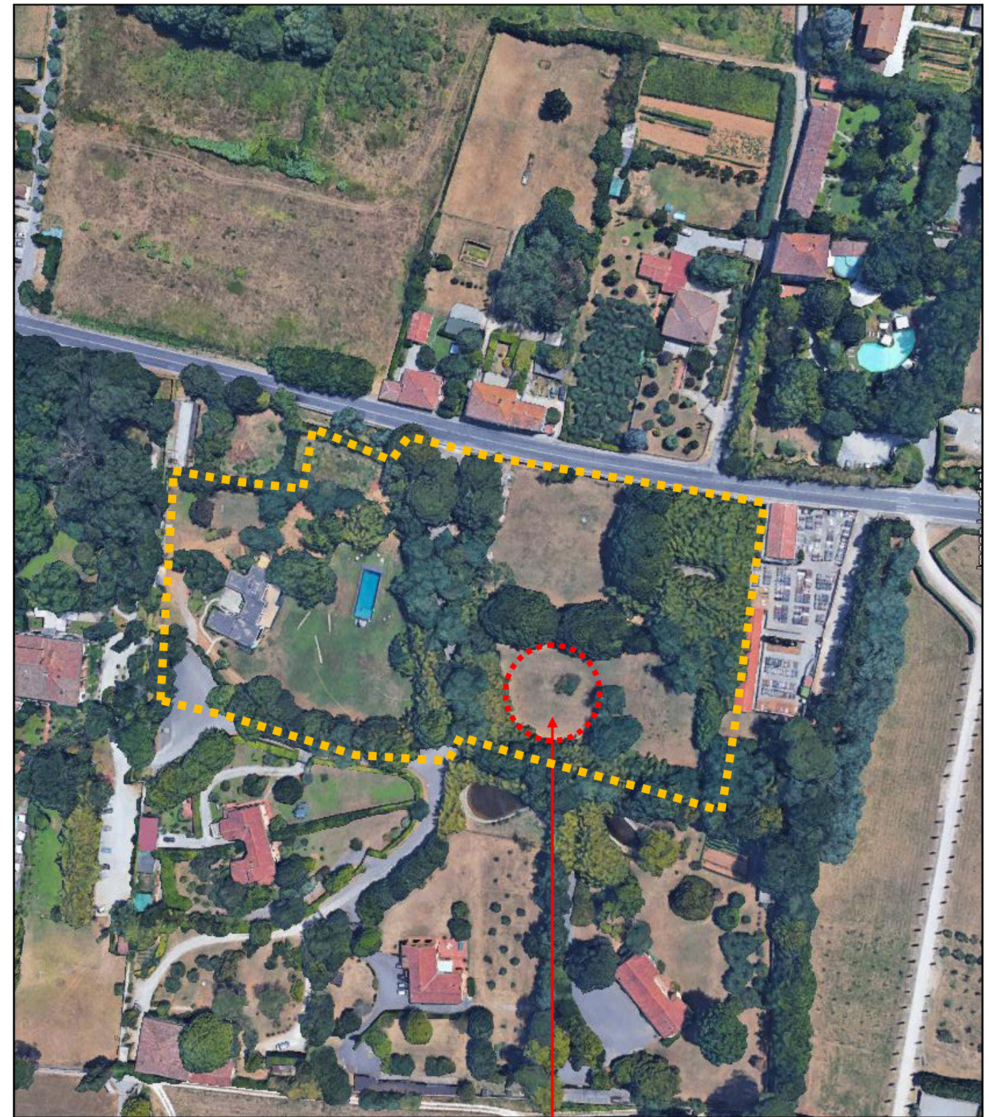
AREA OGGETTO DI PdR E CONTESTUALE VARIANTE AL RU ■■■■■■■■■■