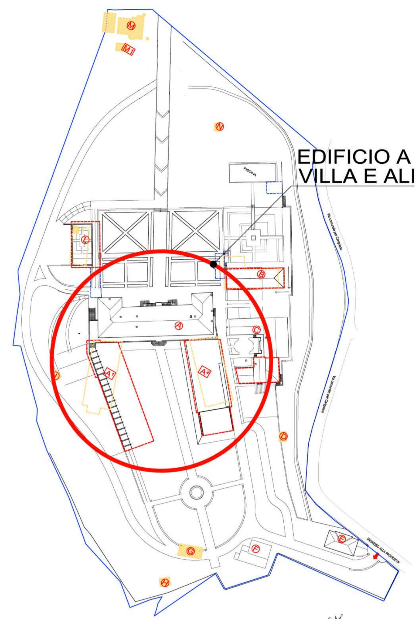
Scala 1:1000 PLANIMETRIA GENERALE