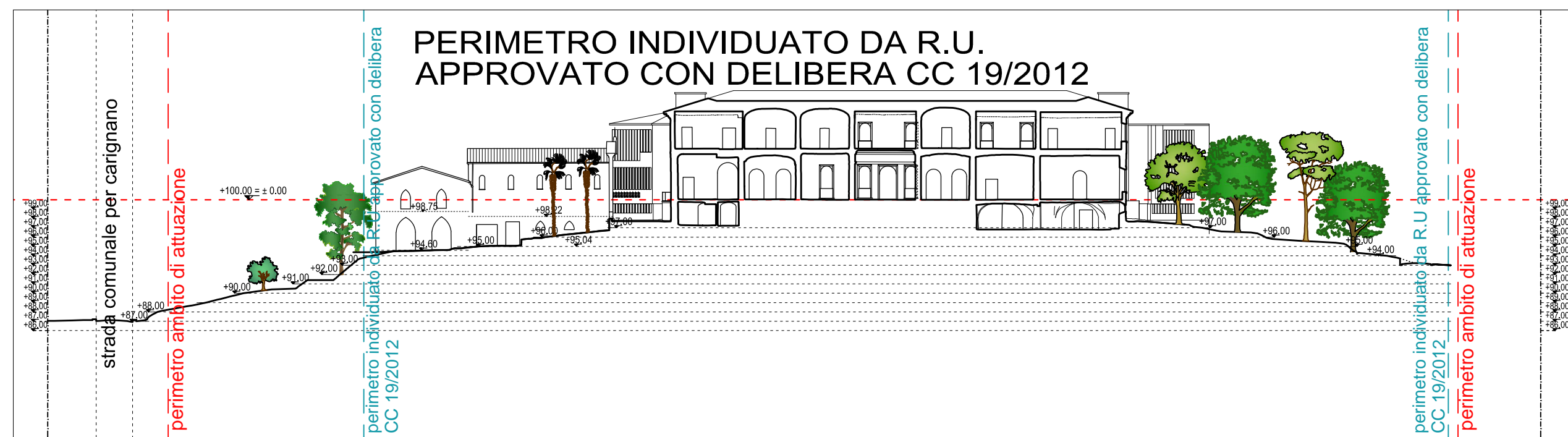
SEZIONE E PROFILI SUD EST_Scala1:500