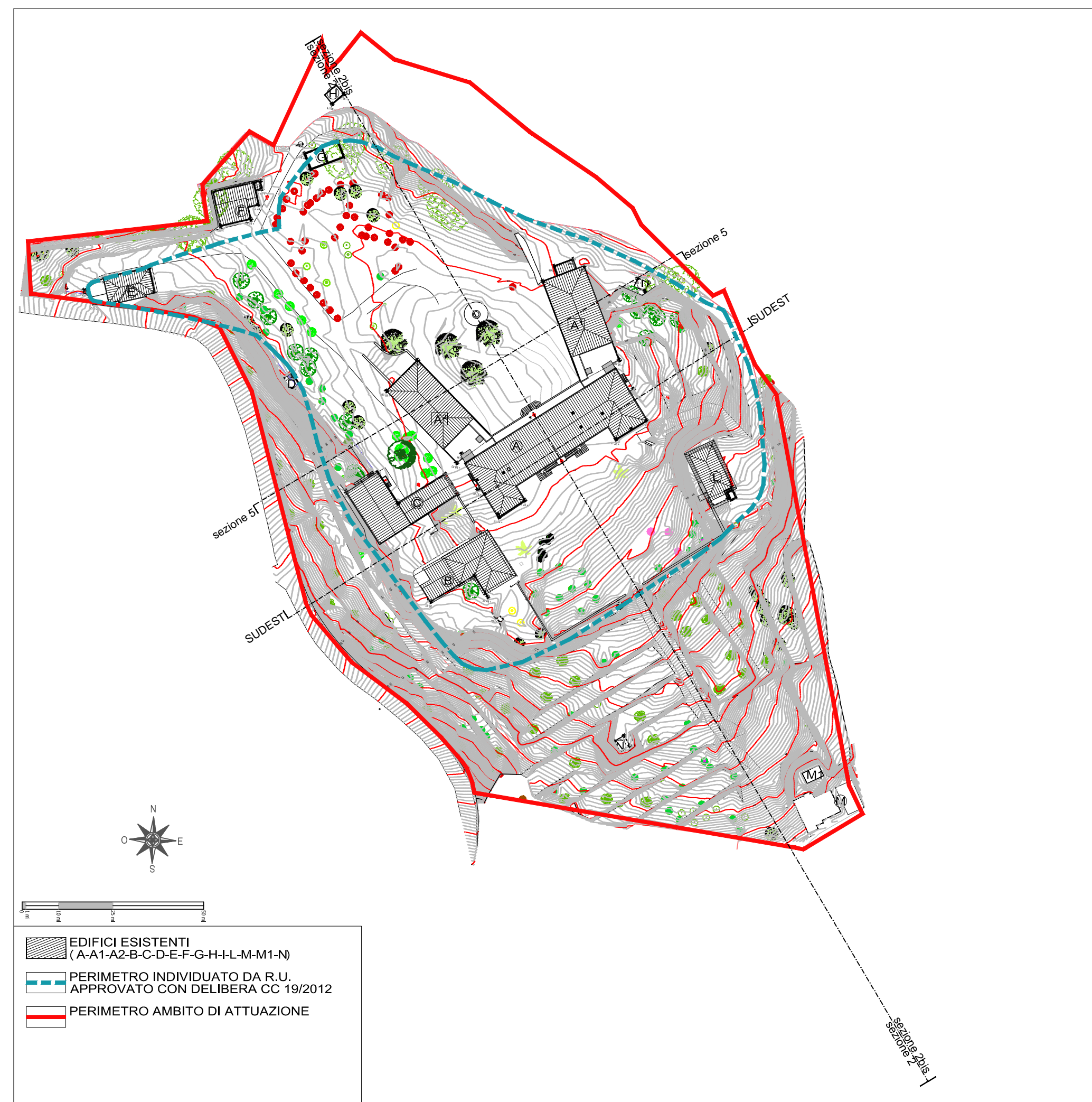
PLANIMETRIA STATO ATTUALE_Scala1:1100